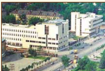
Межрегиональный учебный центр Банка России (г. Тула)