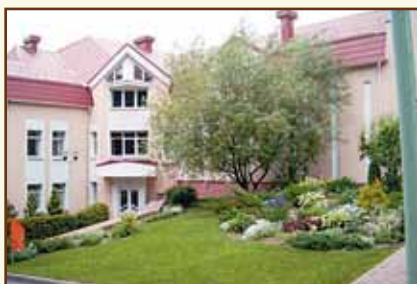
Учебный центр Национального банка Республики Беларусь (д. Раубичи)