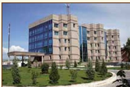
Национальный банк Таджикистана Административное здание

734003, Республика Таджикистан, г. Душанбе, пр. Рудаки, 107а Факс: (992 44) 600 – 32 – 35