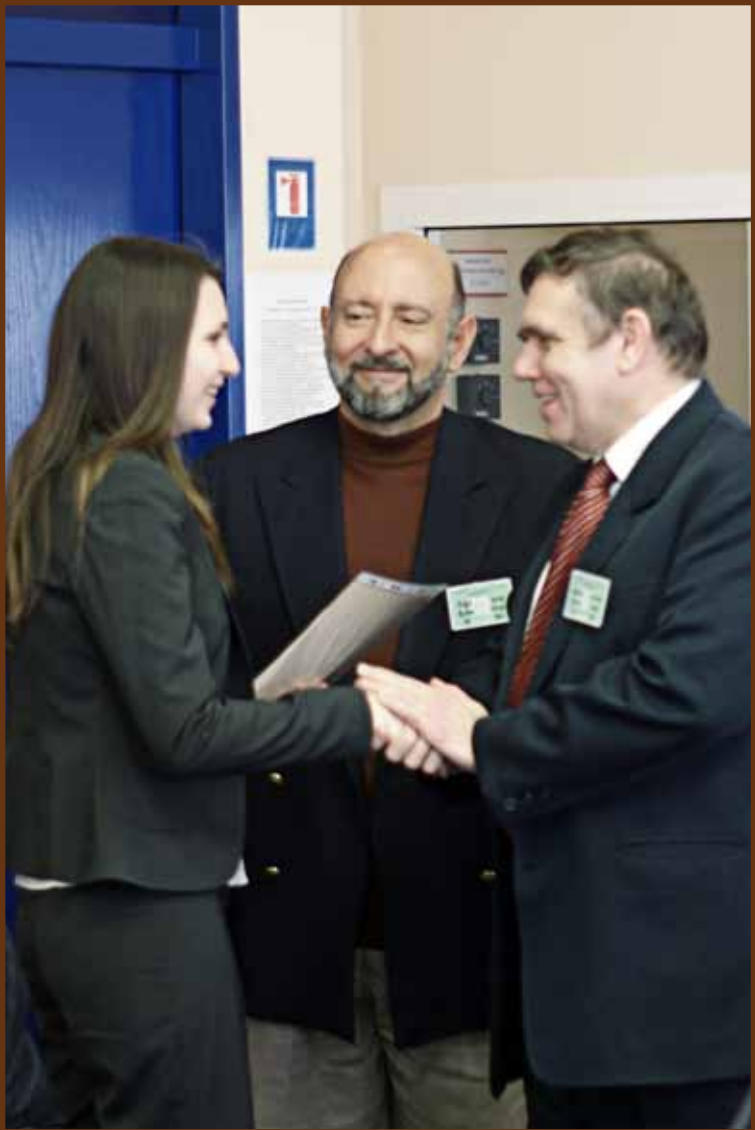
график проведения семинаров