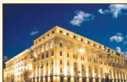
Национальный банк Республики Беларусь Административное здание