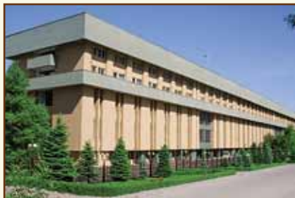
Национальный банк Республики Казахстан Административное здание

050040, Республика Казахстан, г. Алматы, мкр-н «Коктем – 3», 21 Факс: (7 727) 261 – 73 – 52, 270 – 47 – 03, 270 – 47 – 99