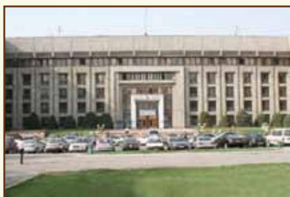
Агентство Республики Казахстан по регулированию и надзору финансового рынка и финансовых организаций Административное здание

050000, Республика Казахстан, г. Алматы, ул. Айтеке би, 67 Факс: (7 727) 272 – 52 – 97