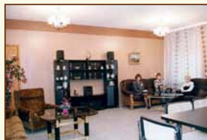
Комната для преподавателей