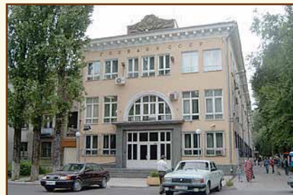
Национальный банк Кыргызской Республики Административное здание