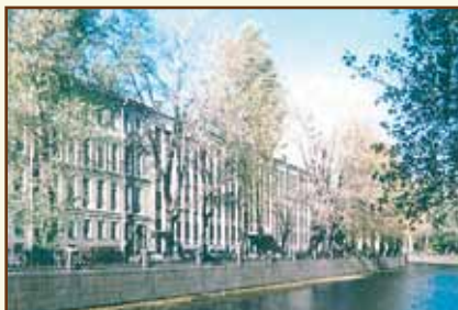
Санкт-Петербургская банковская школа (колледж) Банка России