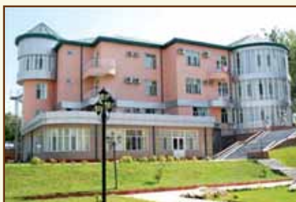
Учебно-оздоровительный центр Национального банка Таджикистана (г.Кайраккум)